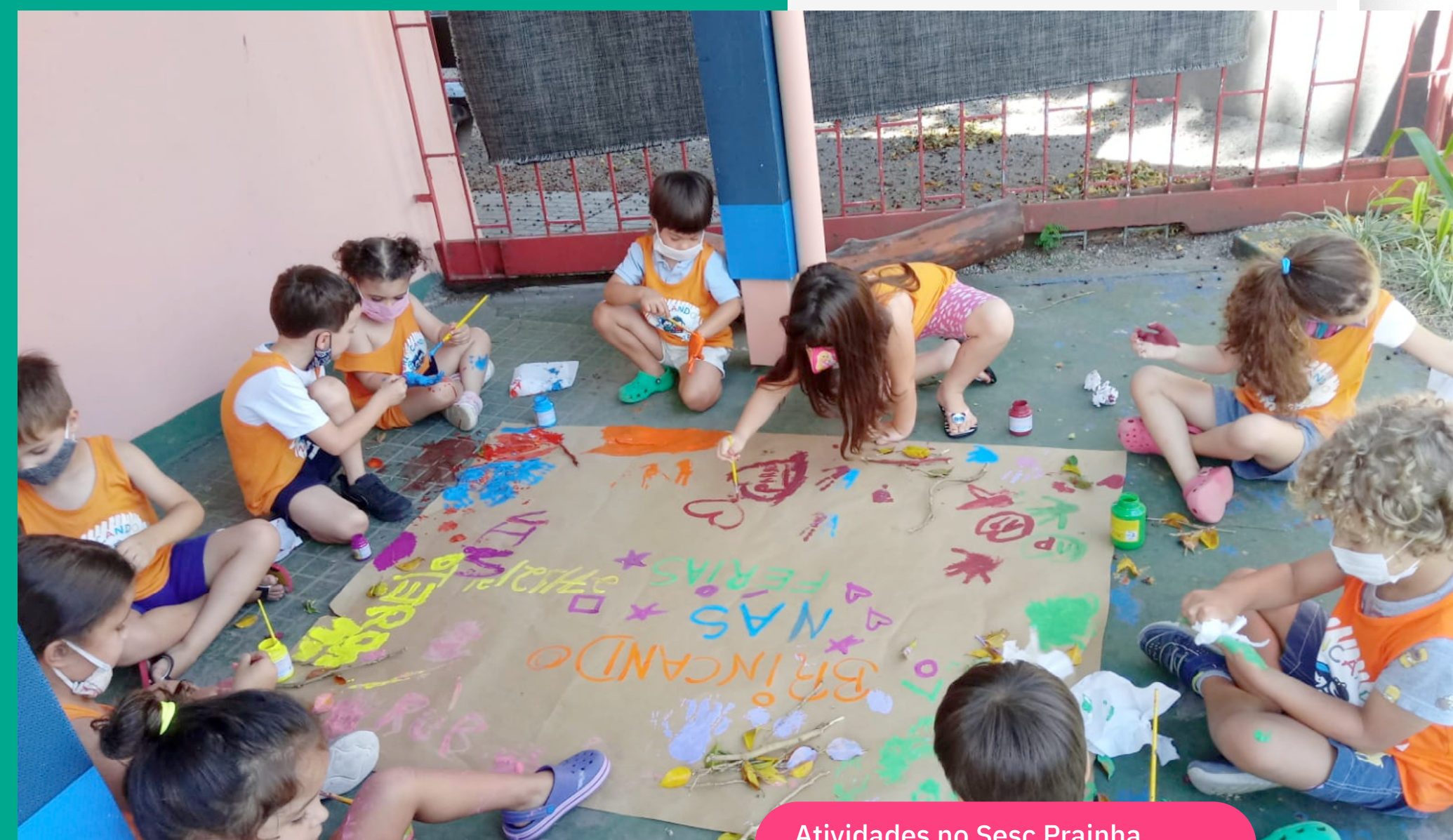
Atividades no Sesc Prainha, em Florianópolis

Clique aqui para mais informações sobre inscrições, datas, horários, valores e programações desenvolvidas em cada unidade.